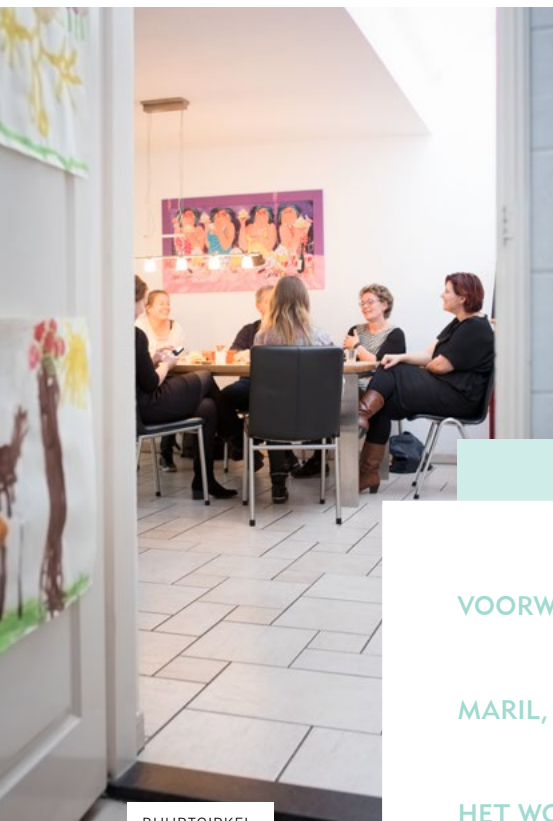
BUURTCIRKEL: VOOR ELKAAR (PAGINA 6)